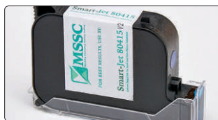
Cartucho HP TIJ 2.5