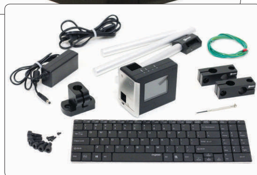
Partes Inclusas no equipamento