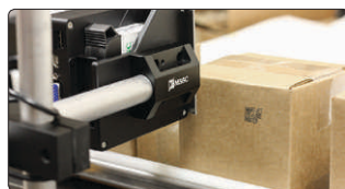
Mecanismo anti choque