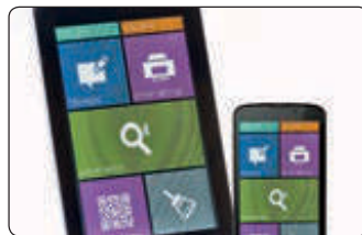
App opera em Android ou iOS