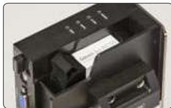
Novo desenho do cabeçote