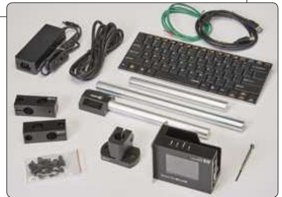
Partes incluídas na impressora