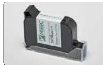
Cartucho HP TIJ 2.5